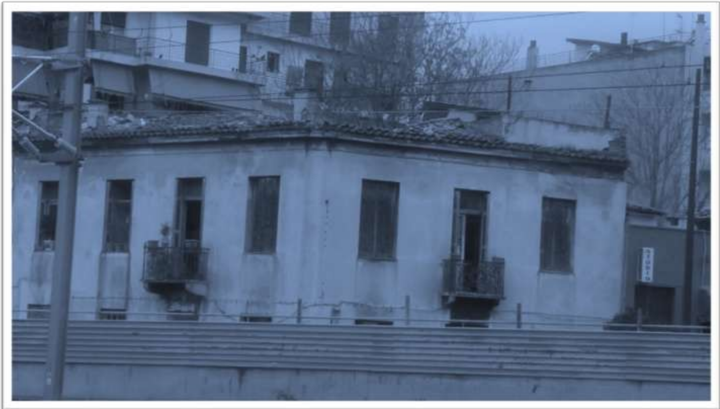
Εγκαταλελειμμένα κτίρια...φορείς μιας ιστορίας