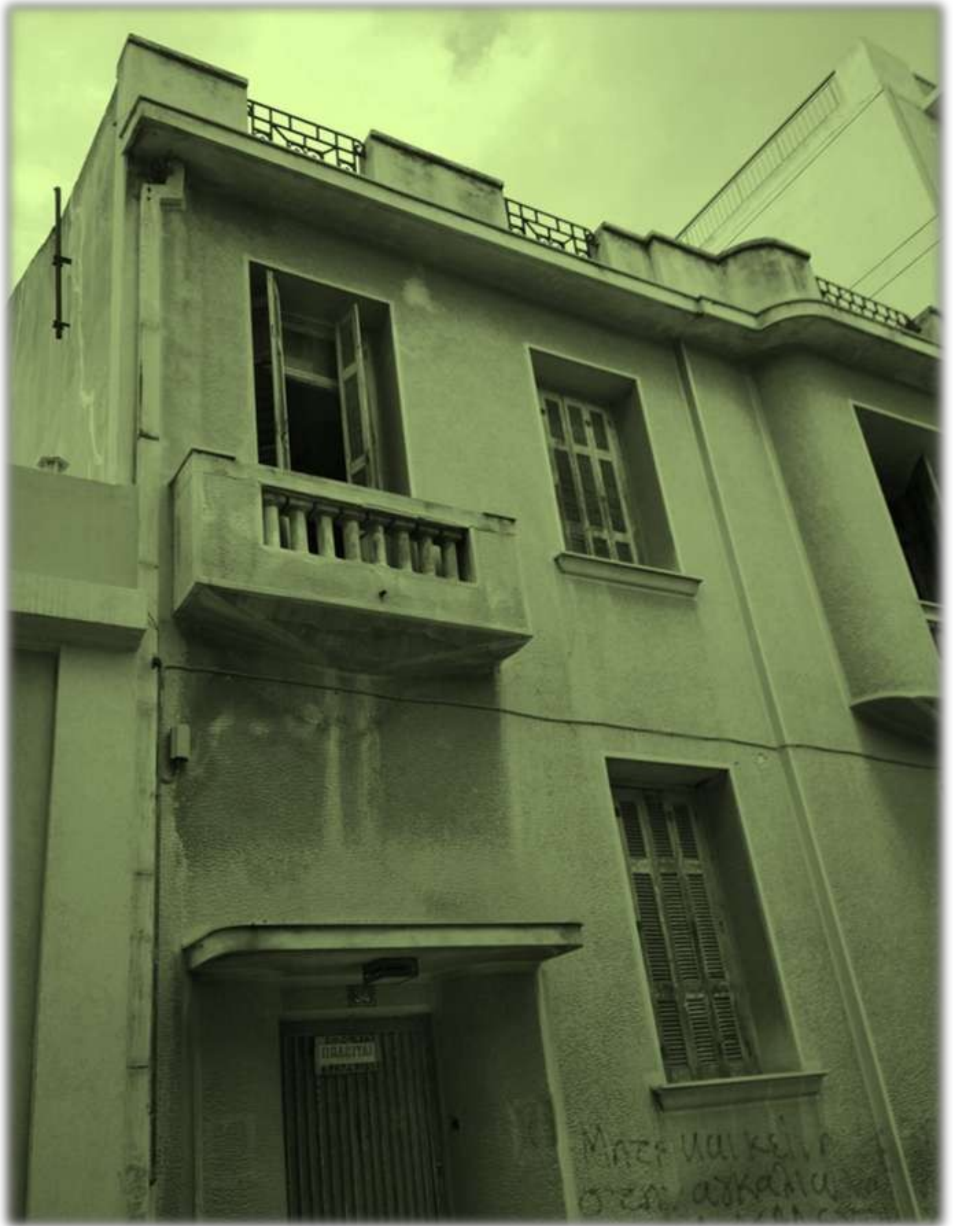
Διάφορες αρχιτεκτονικές συνυπάρχουν...