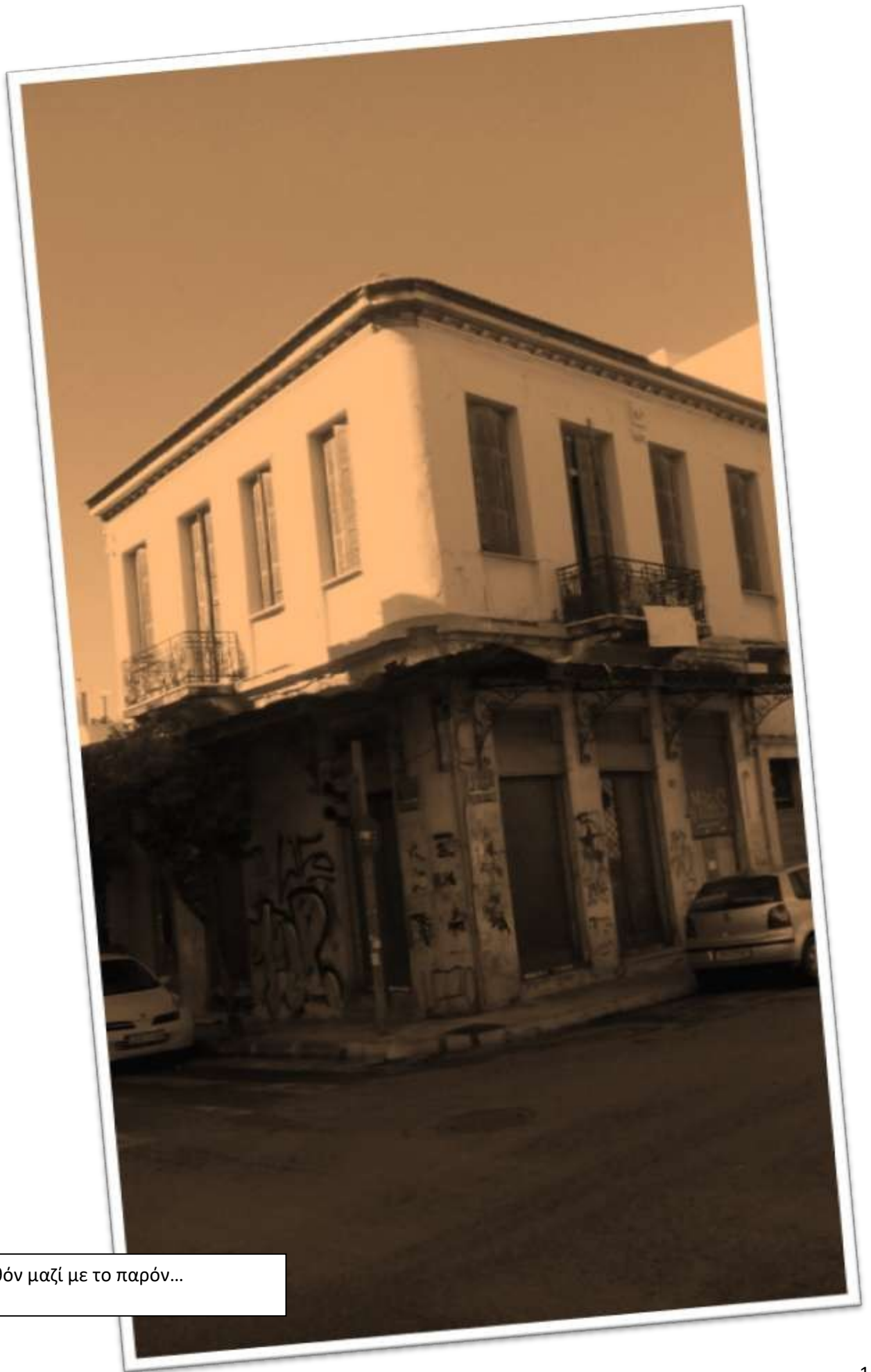
Το παρελθόν μαζί με το παρόν...