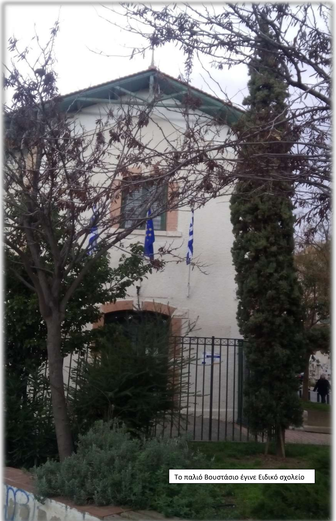
Το παλιό Βουστάσιο έγινε Ειδικό σχολείο