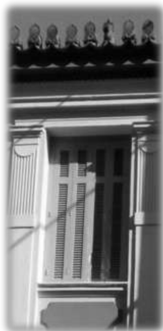
στη γωνιά του σχολείου μας....